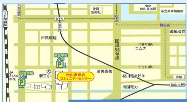
松山市総合コミュニティセンター周辺案内